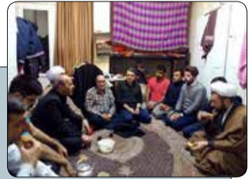
به مناسبت هفته وحدت و روز دانشجو؛ رئیس دانشگاه علوم پزشکی تبریز در جمع صمیمی دانشجویان خوابگاهی حضور یافت

وی در آخر گفت: توانمندی دانشگاه باید در خدمت حل مشکلات و بهبود زندگی مردم قرار گیرد.