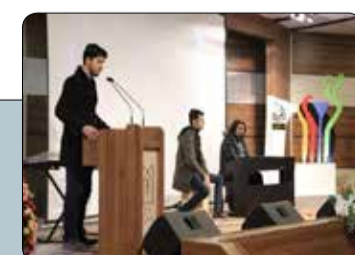
اولین آیین اختتامیه هشتمین جشنواره فرهنگی هنری «صنوبر» برگزار شد