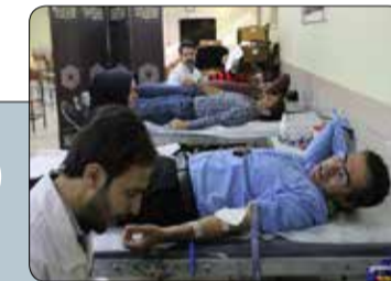
مشارکت ۶۰ نفر از اساتید، کارکنان و دانشجویان دانشگاه علوم پزشکی تبریز در برنامه «اهدای خون»