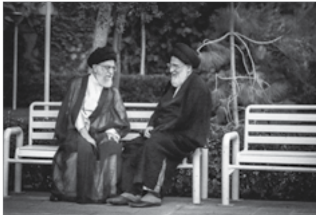
تصویری از مرحوم آیت‌الله هاشمی شاهرودی در کنار رهبر انقلاب

آن کسی که برای انقلاب، برای امام، برای اسلام کاری کند، به مجردی که ببیند حرف او، حرکت او موجب شده است که یک جهت‌گیری‌ای علیه این اصول به وجود بیاید، فوراً متنبه می‌شود. چرا متنبه نمی‌شوند؟ وقتی شنفتند که از اصلی‌ترین شعار جمهوری اسلامی - «استقلال، آزادی، جمهوری اسلامی» - اسلامش حذف می‌شود، باید به خود بیایند؛ باید بفهمند که دارند راه را غلط می‌روند، اشتباه می‌کنند؛ باید تبری کنند... باید متنبه بشوند، باید خودشان را بکشند کنار، بگویند نه، ما با این جریان نیستیم... باید بفهمند؛ بفهمند که کارشان یک عیبی دارد؛ بلافاصله برگردند بگویند نه، مانمی‌خواهیم حمایت شما را... یا می‌شود با بهانه‌های عقلانیت، این حقایق روشن را ندیده گرفت، که ما عقلانیت به خرج می‌دهیم؛ این عقلانیت است که دشمنان این ملت و دشمنان این کشور و دشمنان اسلام و دشمنان انقلاب، شما را از خود بدانند و برای شما کف و سوت بزنند، شما هم همینطور خوشتان بیاید، دل خوش کنید؛ این عقلانیت است؟! ● ۸۸/۹/۲۲