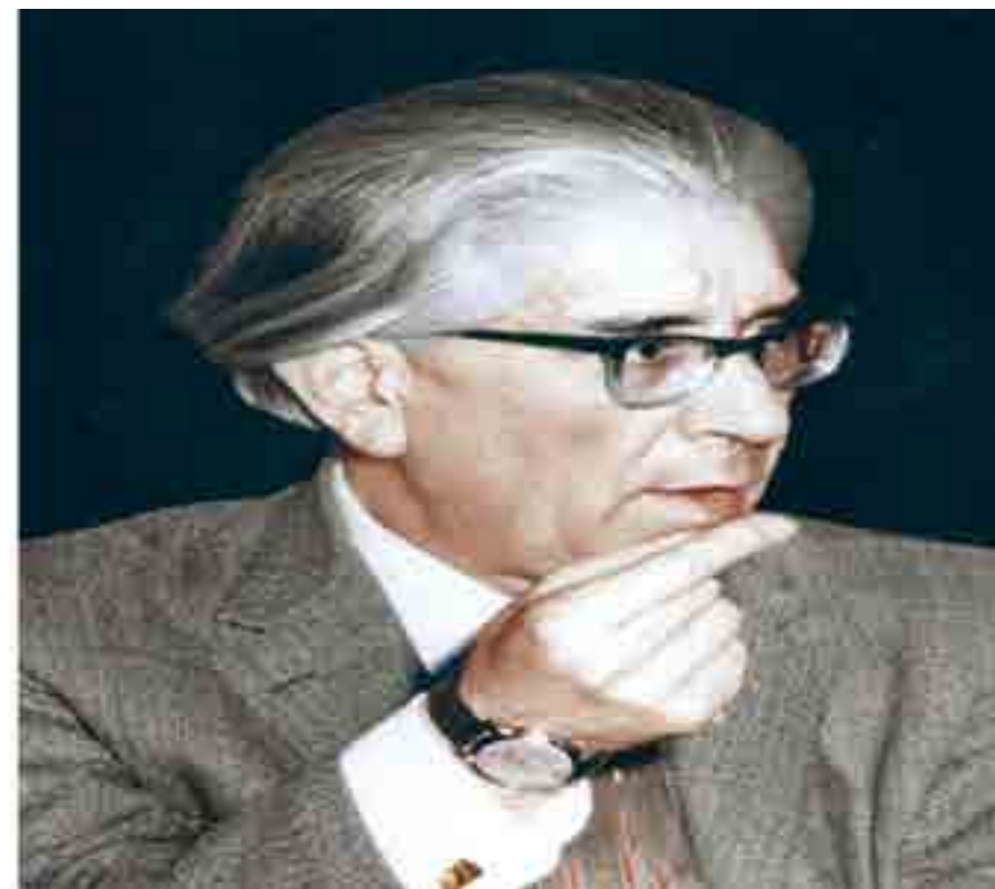
پروفسور محسن هشترودی