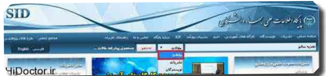
به عنوان مثال با وارد نمودن واژه "تغذیه سالم" نتایج زیر حاصل می شود:

بالای صفحه وارد نموده و نوع جست و جوی خود را بر اساس مقاله، نام نویسنده و یا نام نشریه مشخص می نماید و با کلیک نمودن دکمه جست و جو وارد صفحه نتایج می شود. جستجو بر اساس نام مقالات: چنانچه جست و جو برای یافتن مقالات باشد، در صفحه نتایج مقالاتی نمایش داده می شود که واژه وارد شده در بخشی از عنوان مقاله و یا کلیدواژه وجود داشته باشد.